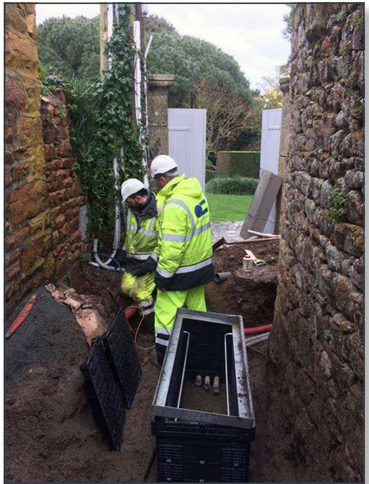
Île de Bréhat

Deux agents interviennent en appui des secteurs techniques. Ils établissent les avant-projets et coordonnent les programmations notamment avec les opérateurs de réseaux.